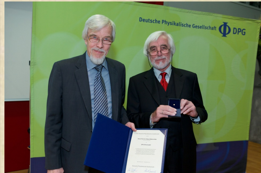
Der DPG-Präsident, Prof. Dr. Rolf-Dieter Heuer (l.), überreicht die Urkunde.