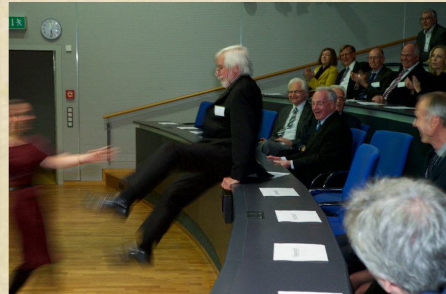
Auf dem Sprung zum ...